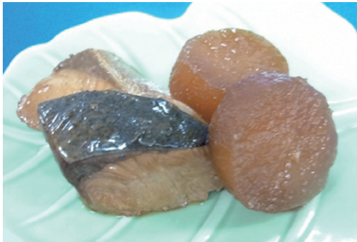
だいこん ぶり大根 品番 804111