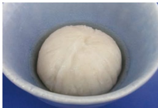
むもの 蒸し物ベース(れんこん) 品番 201831