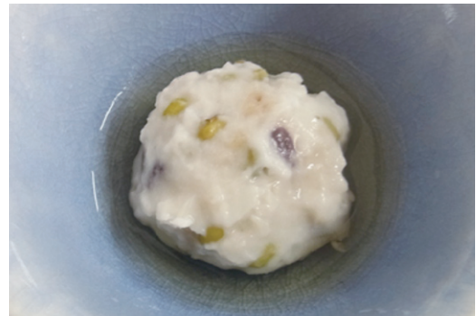
はぎまんじゅう 萩万頭(れんこん) 品番 201861